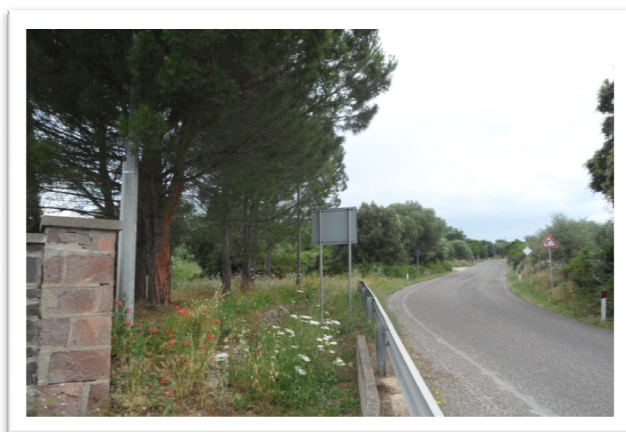
S.S. 22 direzione Scano di Montiferro