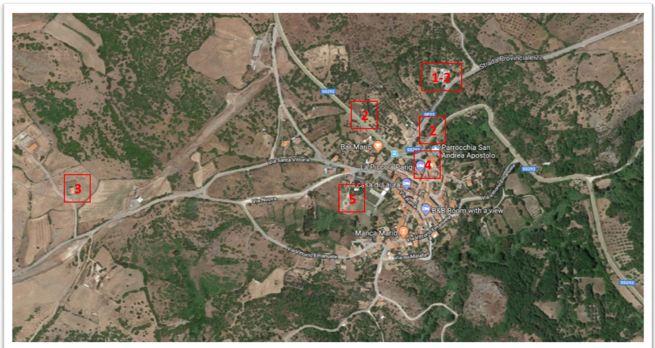
Centro abitato di Sennariolo con indicazione della posizione delle nuove telecamere

Le nuove 10 telecamere saranno installate sui pali dell'illuminazione pubblica esistenti e collegate alla linea elettrica che alimenta l'illuminazione pubblica.