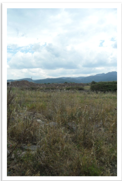
Parco San Sebastiano