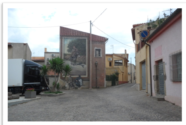
via Marconi e Piazza Rimembranza