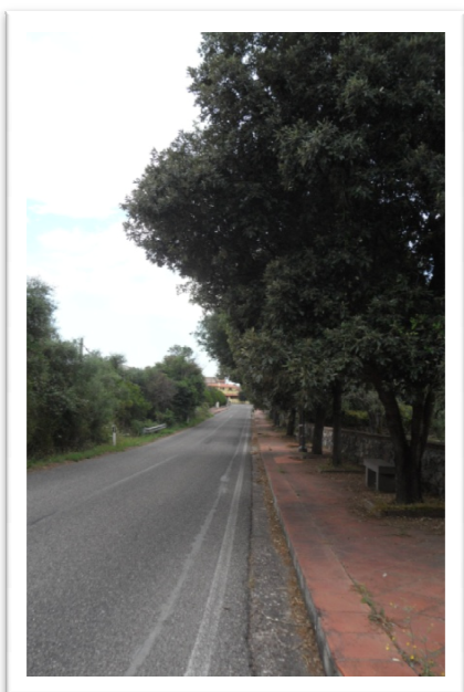
S.P. 22 direzione centro abitato Sennariolo