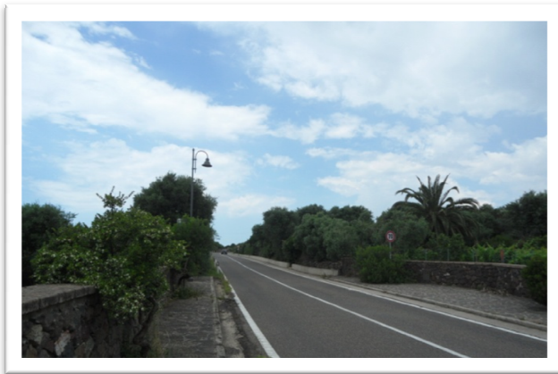
S.S. 292 direzione Tresnuraghes